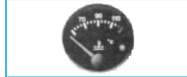
Indicateur de température d'eau