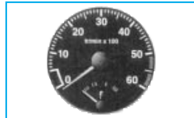
Compte-tours (version Diesel)